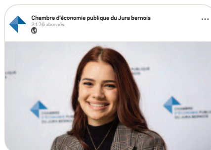
in La CEP célèbre l'excellence dans la formation professionnelle