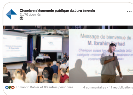
in La CEP célèbre l'excellence dans la formation professionnelle