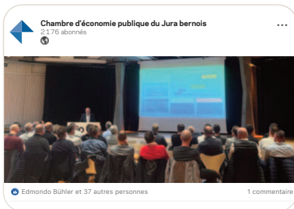
in Approvisionnement électrique: la CEP a établi un plan d'action en lien avec les quatre niveaux de mesures OSTRAL