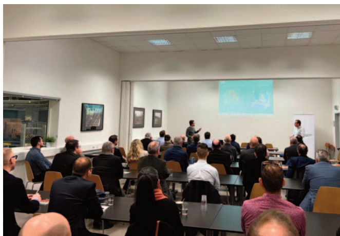
15 mars Petit-déjeuner microtechnique – Schaublin 12 mai Petit-déjeuner des services – Swiss Energypark