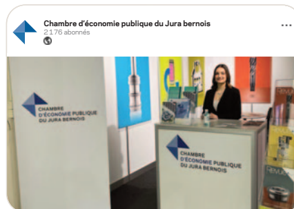
in La Chambre d'économie publique du Jura bernois présente au SIAMS 2022