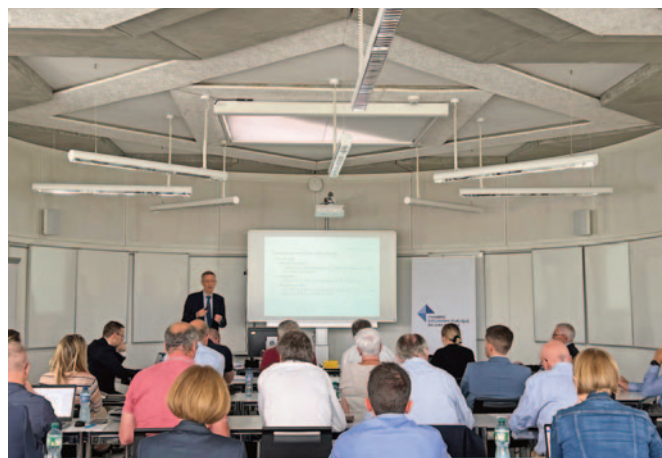
28 juin Séminaire Patent Box et déduction