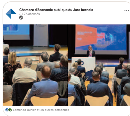
in Avantages et défis du transport ferroviaire de marchandises: conférence de Désirée Baer, CEO de CFF Cargo SA