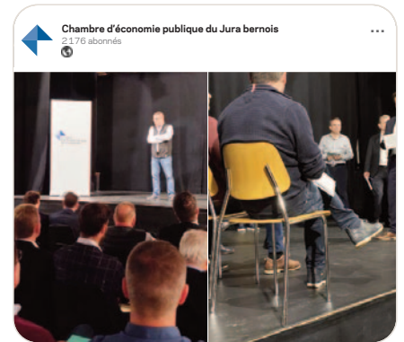
in Les 50 commissaires de la Chambre d'économie publique du Jura bernois (CEP) réunis pour une convention 2022