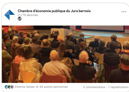
in Dans les cuisines d'Infrarouge avec Alexis Favre, présentateur à la RTS - Radio Télévision Suisse.