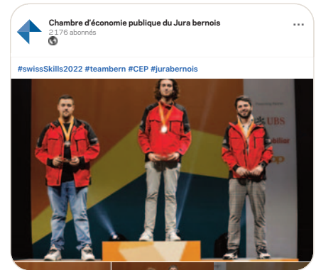
in Quatre médailles d'or, une d'argent et trois de bronze aux #SwissSkills2022 pour les représentants francophones bernois