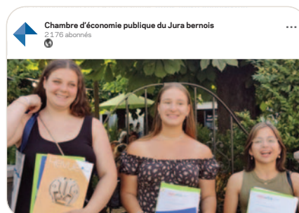
in PRO»pulse, stage professionnel en Allemagne: première volée