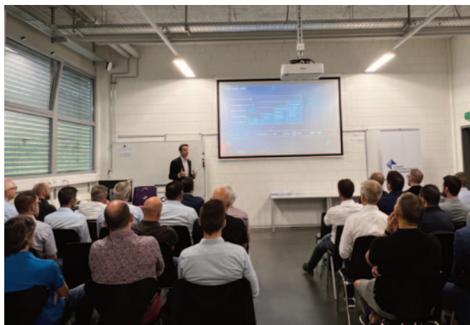
22 juin Petit-déjeuner microtechnique – Un microatelier de décolletage connecté: coulisses, coordination 1 er septembre Petit-déjeuner des services – Cyberrisque et digitalisation