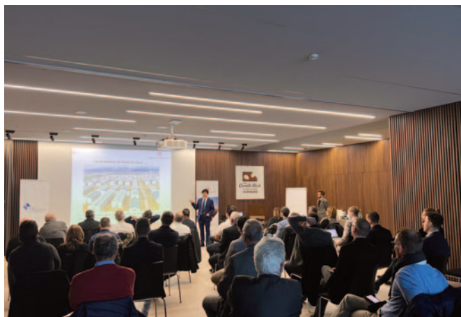
25 janvier Petit-déjeuner des services – La Chine aujourd’hui: quels (nouveaux) risques et opportunités pour les entreprises suisses?