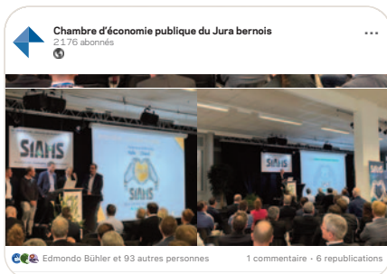
in La chaîne de production des micro-techniques: un socle pour l'industrie du futur