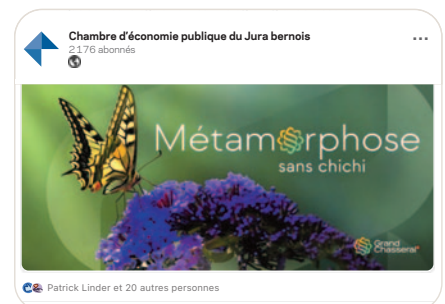
in Un instrument de communication harmonisé servant l'attractivité économique régionale