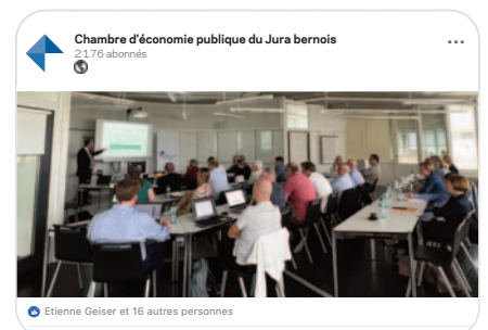
in Séminaire Patent Box et déduction supplémentaire pour des frais de R&D à l'aide d'exemples pratiques