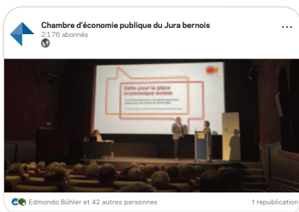
in Unanimité et enthousiasme lors de la 42 e Assemblée générale de la Chambre d'économie publique du Jura bernois (CEP)