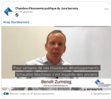
in Quelle est la transition technologique menée par Schaublin Machines SA sur la base de produits historiques à succès?