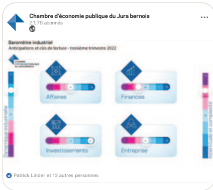
in L'industrie de la précision maintient le cap