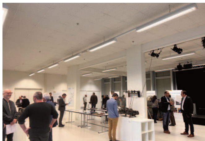
29 septembre Petit-déjeuner microtechnique – De Junker à Tornos, 1880-1980