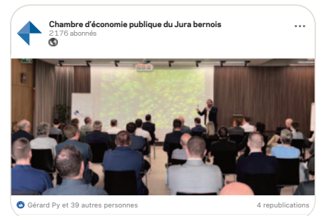
in «Swiss Energy Park: un épicerie de la transition énergétique»