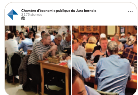
in Le Club-Entreprises de la CEP a partagé sa traditionnelle fondue à la Tête de Moine AOP