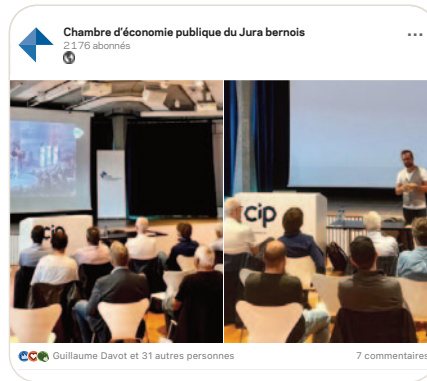
in Moment de grande émotion avec Mathieu Jatton, CEO du Montreux Jazz Festival